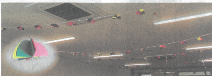
「傘制作」(裏面) お部屋に飾りました。