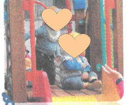
たくさん遊んだよ