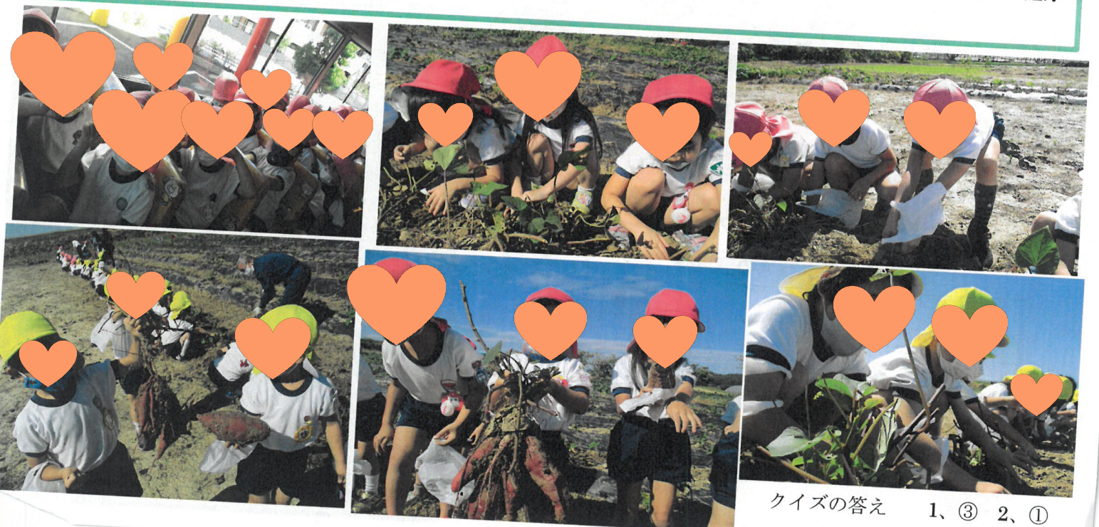
クイズの答え 1、③ 2、①

芋掘りに行くのが待ちきれない子ども達。お支度が終わった後に「いつ行く?」「早く行きたい。」と楽しみにしていました。芋掘りの時間になり、いざ出発!!バスの中では、どんなお芋が採れるか、力持ちで掘るぞ!とお友達同士会話をし、気合い十分。畑に着くと、両方の手で土を掘り大きなお芋を掘りました。帰りのバスでは、薩摩芋の料理をみんなで考えました。