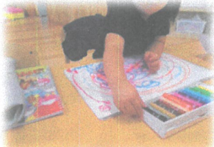
色々な色でお絵かき楽しい！