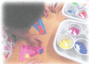
好きな色をペタペタペタ