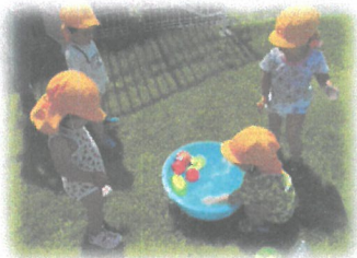
大丈夫！ お水、気持ちが良いよ！！

最初は水に慎重だったお友だちも、毎日の様に水遊びをする内にダイナミックに遊べるようになってきました！