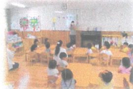
朝の会も上手だよ お返事「は〜い！」